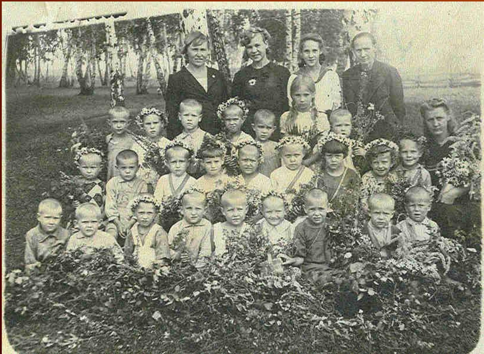
Дети и воспитатели детского дома завода «Азот» [1942-1944], г. Кемерово