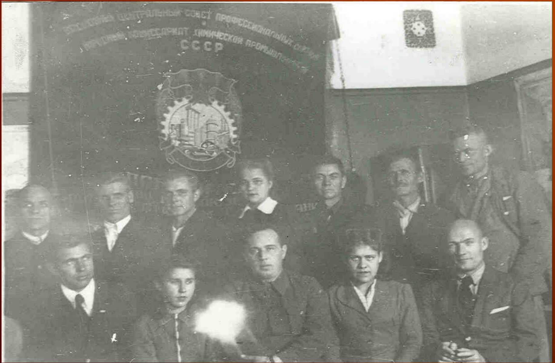
Передовики производства завода «Карболит» 1944 год, г. Кемерово