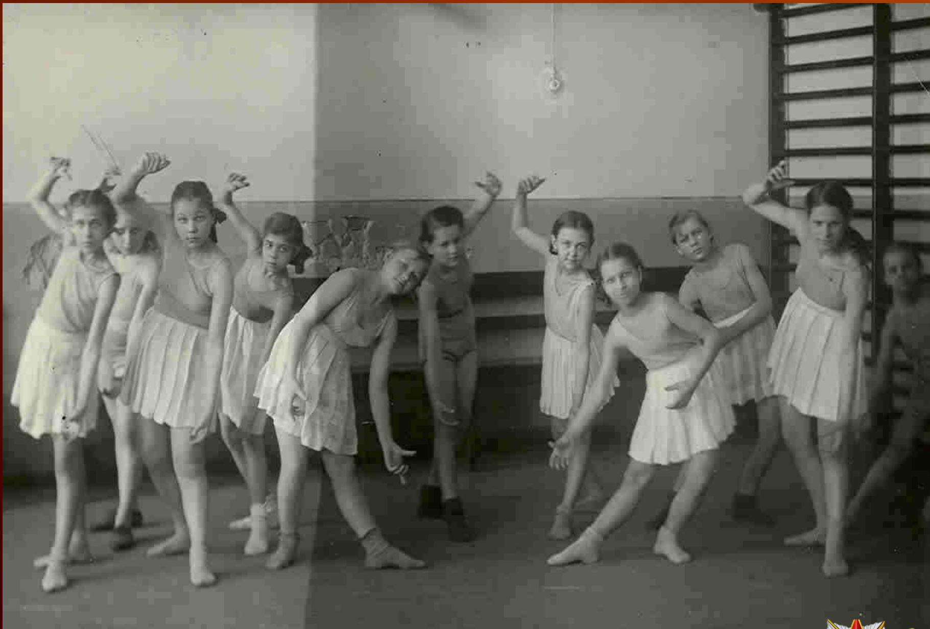
Танцевальный кружок средней школы № 8 г. Кемерово, 1944 год