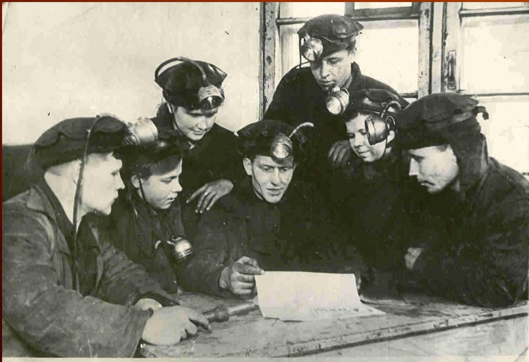
Бригада шахтеров ш. «Северная» г. Кемерово, 1943 г.