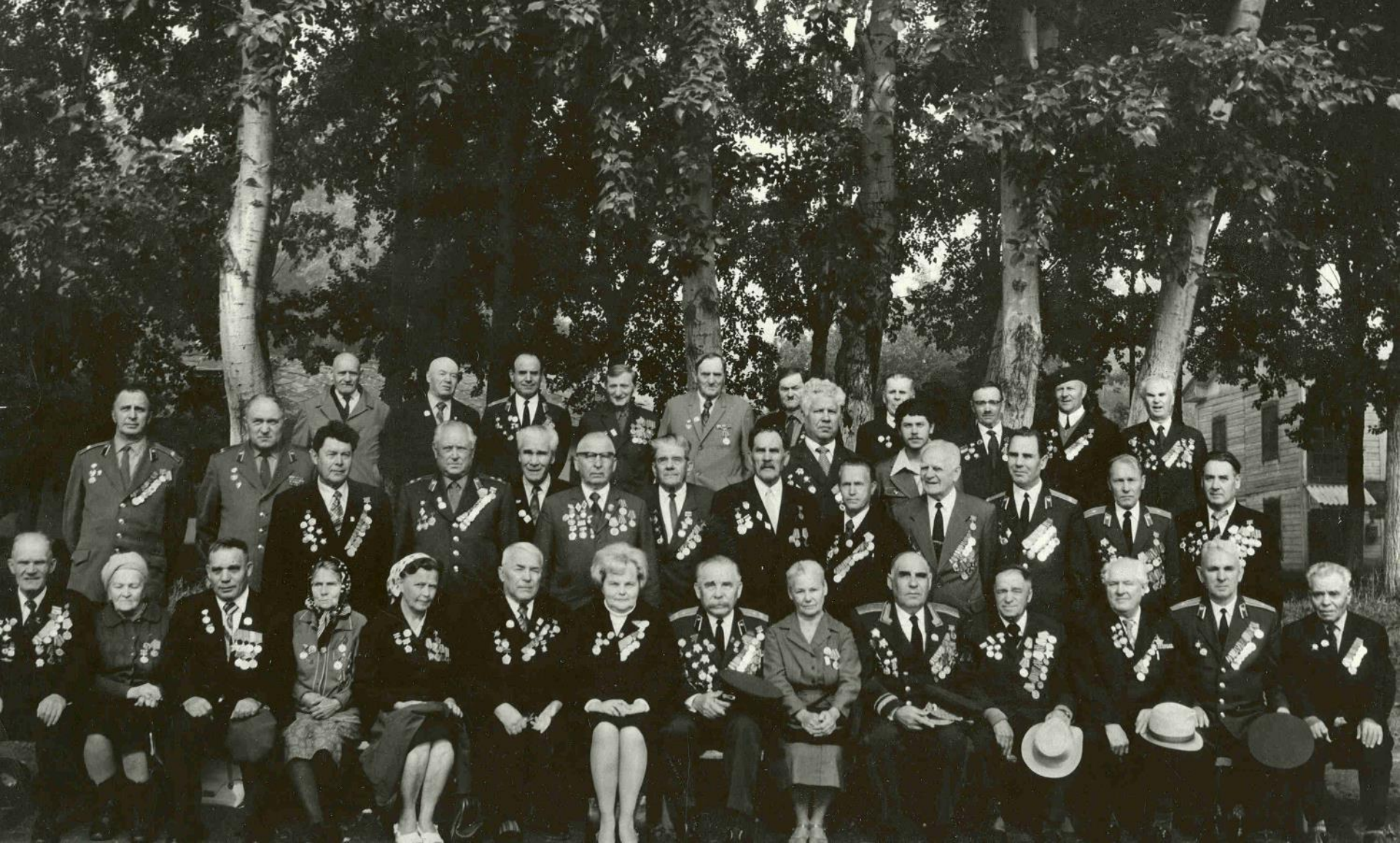
Кузбасские ветераны Великой Отечественной войны, 1981 г. Кемерово