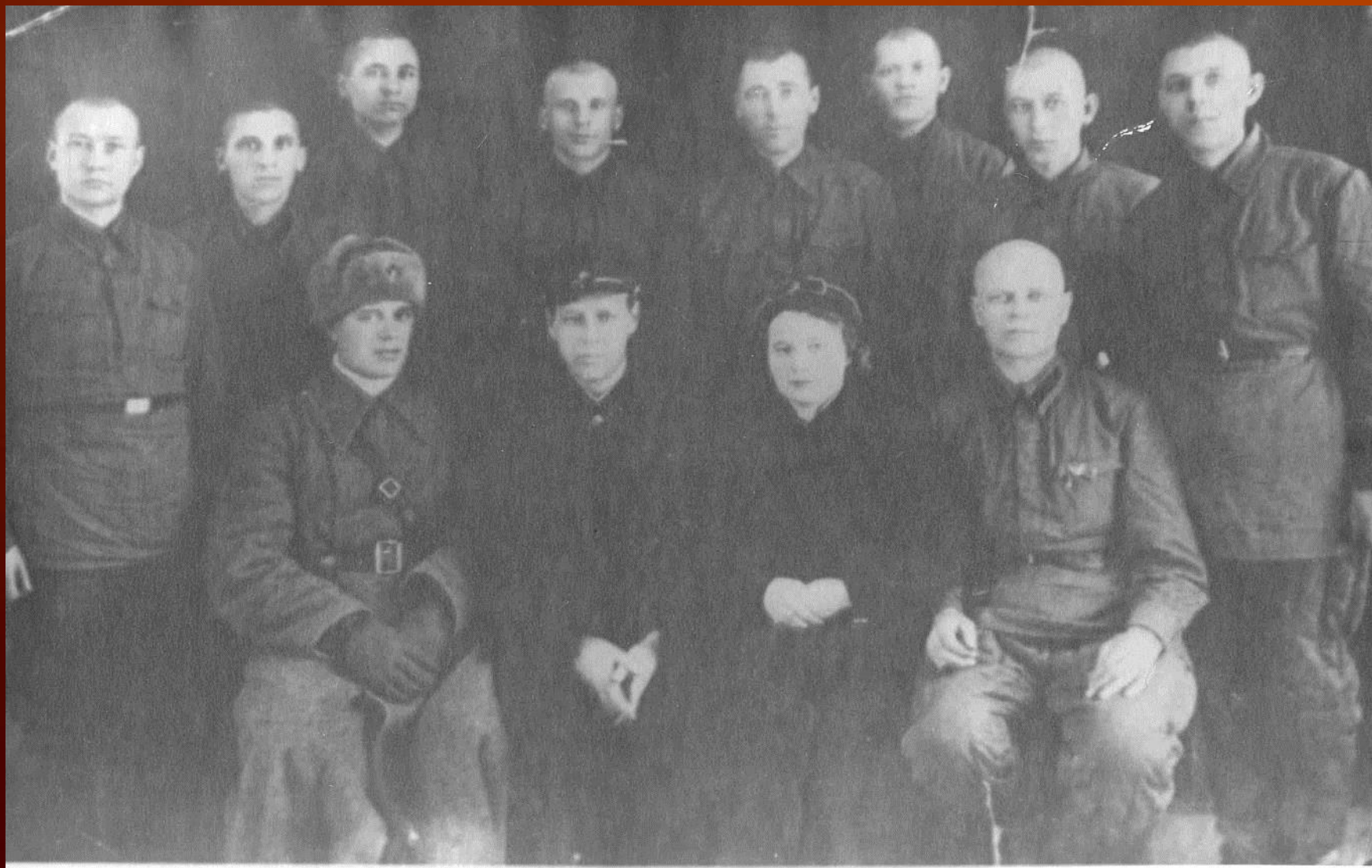
Работники связи г. Кемерово перед уходом на фронт