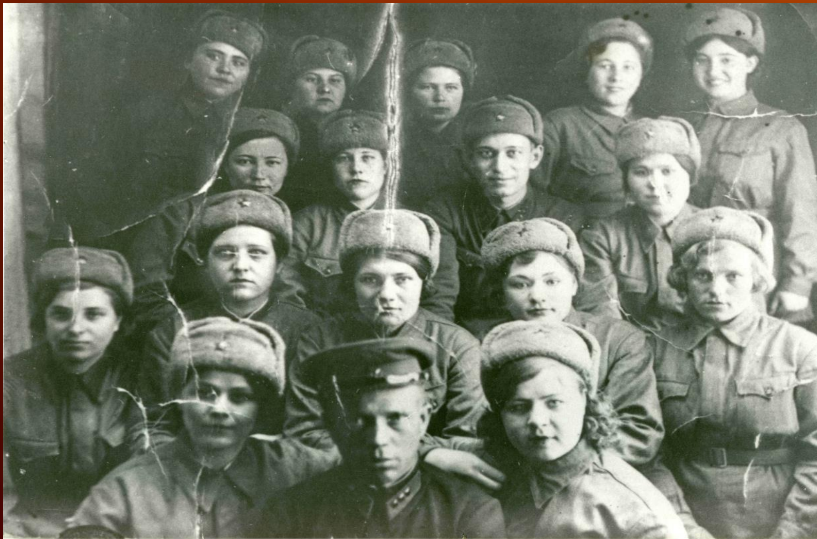
Бойцы 303-й Сибирской добровольческой стрелковой дивизии перед отправкой на фронт. Ст. Топки, [1942] год