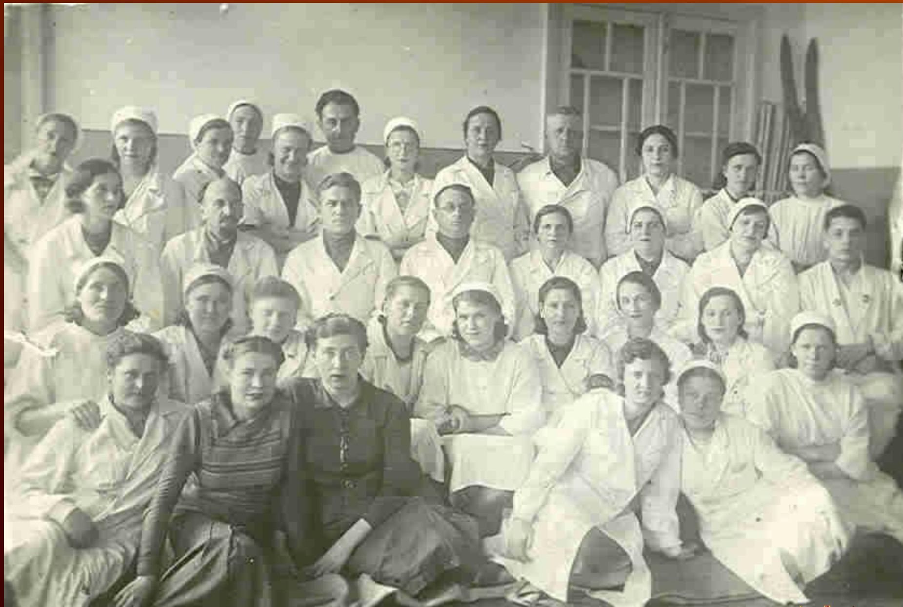
Персонал госпиталя № 3629. Март 1944 год, г. Кемерово