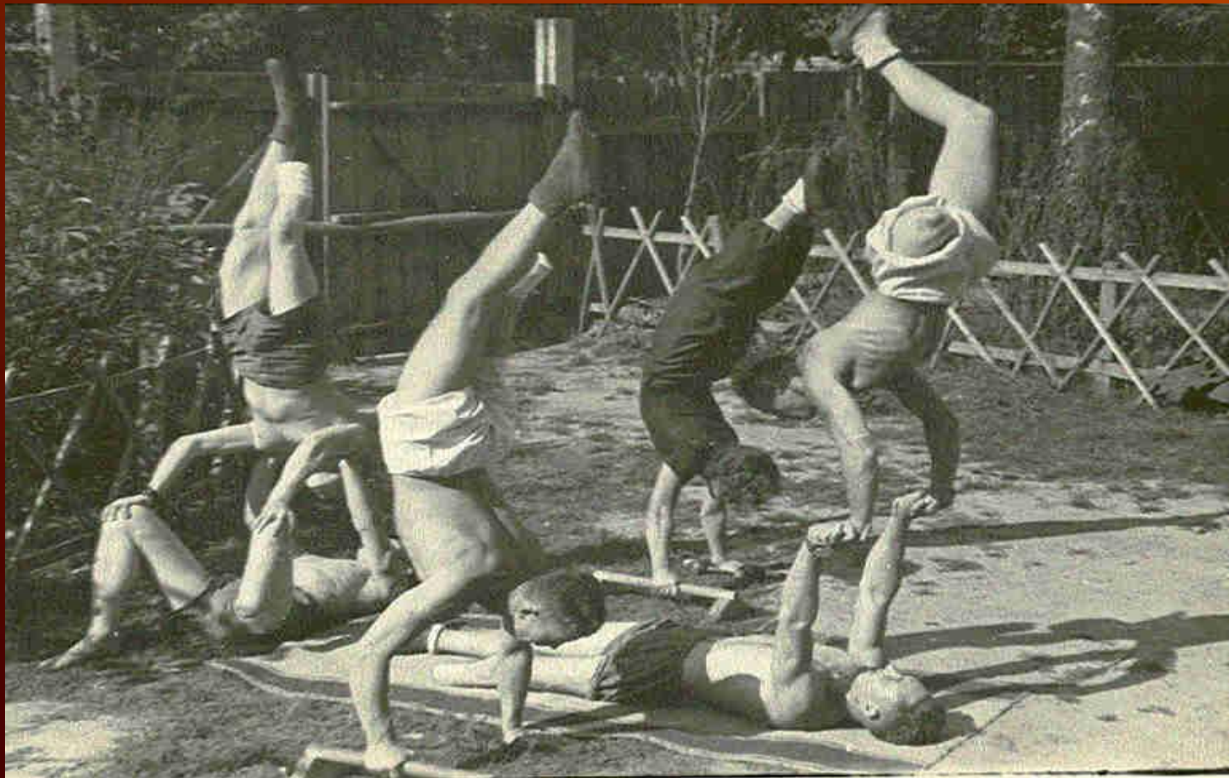
Занятия лечебной гимнастикой раненых солдат, находившихся на излечении в эвакогоспитале № 3629, 1944 год, г. Кемерово