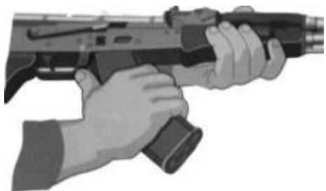
Рис. 7.11. Отделить магазин