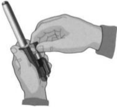
Рис. 7.17. Отделить затвор от затворной рамы