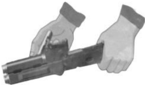
Рис. 7.18. Отделить газовую трубку со ствольной накладкой

8. Отделить газовую трубку со ствольной накладкой (рис. 7.18). Удерживая автомат левой рукой, правой рукой надеть пенал принадлежности прямоугольным отверстием на выступ замыкателя газовой трубки, повернуть замыкатель от себя до вертикального положения и снять газовую трубку с патрубком газовой камеры.