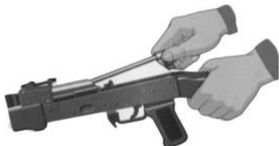
Рис. 7.15. Отделить возвратный механизм