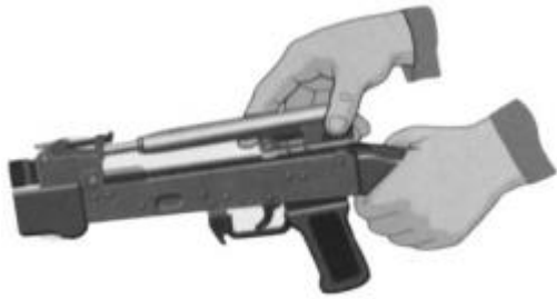
Рис. 7.16. Отделить затворную раму с затвором