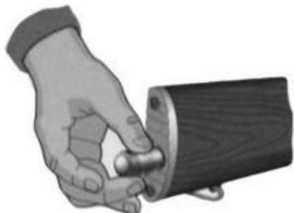
Рис. 7.12. Вынуть пенал с принадлежностью